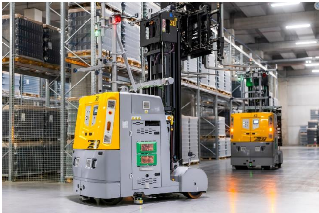
Immagine 2: Il sistema di Boffalora assicura tempi di consegna più rapidi, controllo end-to-end, massima sicurezza per i lavoratori, sostenibilità e trasparenza costante.

Immagine 1: Vetropack ha commissionato un magazzino completamente automatizzato nel suo nuovo stabilimento di 340.000 m 2 a Boffalora sopra Ticino.